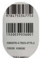
書籍バーコードの例