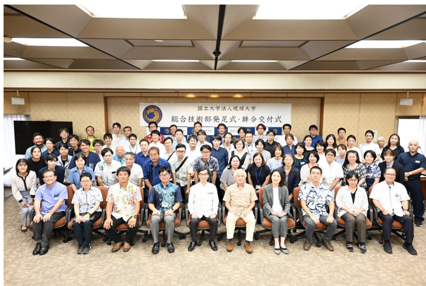
図 1 総合技術部発足式

琉球大学総合技術部は、これまで各部局や各センターに配置されていた技術職員を集約し、全学への技術支援を可能とするための技術支援組織です。技術職員が有する高度な専門技術を特定の部局だけでなく、必要とする分野に提供することで、琉球大学全体の教育・研究力を向上させることを目的に設置されました。また、総合技術部に所属する技術職員の技術継承、技術の高度化及び技術開発について技術職員が中心となってマネジメントを行うことで、大学が必要とする技術を絶え間なく提供し続けることが可能な組織を目指します。