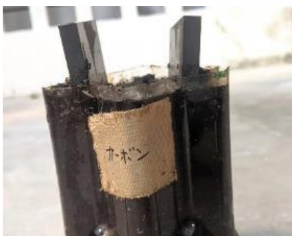
自作微生物燃料電池