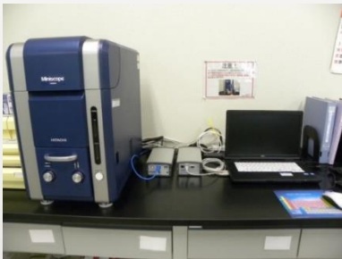
卓上SEM TM3030 (日立ハイテクノロジー)

新型コロナウイルス感染症の状況によっては中止となる可能性もありますが、予めご了承ください。