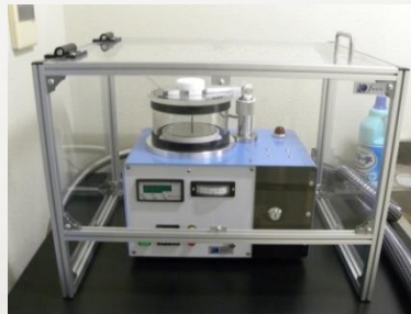
Os蒸着装置 NEOC-Pro (メイワフォーシス)