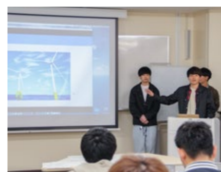
沖縄のエネルギー問題について発表する学生

ます。SDGsの意義はもちろん、17のゴールのオーバラップしている部分や、トレードオフの関係になる部分を国内外の専門家の講義などを通じて知ってもらいます。実情を知り、これからのアプローチを考えるにあたり、この講義で一番大切にしているのは『細分化』と『多様性』です。まずは課題にアプローチするプロセスを細分化します。すると、細分化されたプロセスに意見の異なるさまざまな選択肢が見出され、それらの組み合わせは多様なアプローチを生み出すこととなります。異なる意見をくみ取りながら課題解決へのプロセスを再構築する経験は、グローバル社会で複雑な課題を解決するときの重要な糧となります」