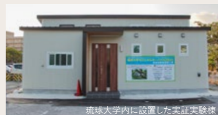
琉球大学内に設置した実証実験棟

開発を行うべく、2019年に琉球大学内に実証実験棟を建てるに至った。今後はこの実証実験で得られたデータを基に建築技術の開発をすすめ、同じ亜熱帯地域である東南アジアへの技術展開も視野に入れている。